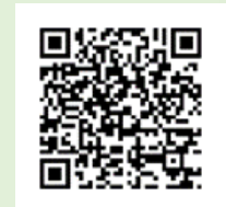
「ラーケーションの日」活動事例集