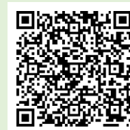
「ラーケーションの日」ポータルサイト

「ラーケーションの日」には、様々な活動ができます。どのような活動ができるのか、どうやって「ラーケーションの日」を取ればよいのかなど、興味をもった人は、おうちの方に配った「保護者用リーフレット」を見たり、右の二次元コードから、「ラーケーションポータルサイト」の「『ラーケーションの日』活動例」を見たりしながら、おうちの方と話し合ってください。